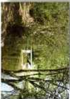
La Cour du Moulin