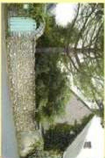
Venir la route Vallée de la Lièvre venir clocher sur la route